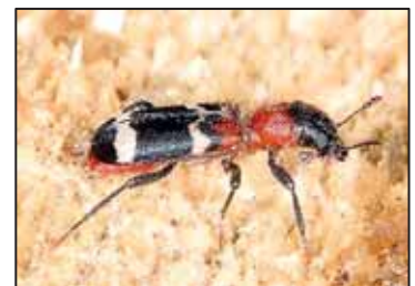
Ameisenbuntkäfer: ein natürlicher Feind des Borkenkäfers

Hat der Borkenkäfer bei Ihnen im Wald für größere Löcher im Bestand gesorgt? Dann ist es eine Überlegung wert, die nächste Waldgeneration durch Pflanzung zu begründen. Welche Baumarten in Zukunft besser geeignet sind als die Fichte erfahren Sie von Ihrem Förster oder im Waldbesitzerportal unter www.waldbesitzerportal-bayern.de .