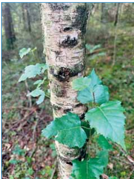
Weiße Birkenrinde mit Laub; Foto: B. Wicht

Ob er dann noch gejagt hat, wissen wir nicht, aber er brachte das Fell des roten Tiers und das Fell des schwarzen Tiers nach Hause, gab sie der Großmutter und sagte: „Und du wolltest nicht, dass ich in den Wald gehe!“